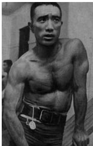
Fig. 5 - Mishima

È interessante vedere come Mishima faccia proprio l’idea di un corpo occidentale e lo innesti nella cultura giapponese. Lo stesso scrittore, negli ultimi anni della sua vita, si dedica a scolpire il suo corpo come una statua greca.