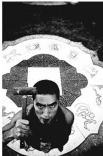
Fig. 6 – Foto tratta dal volume Barakei , di Eikoh Hosoe

Facendo riferimento alla fotografia in fig. 6, abbiamo a che fare con un caso di fotografia che parla del rapporto figurale tra uno scrittore ed la sua cultura.