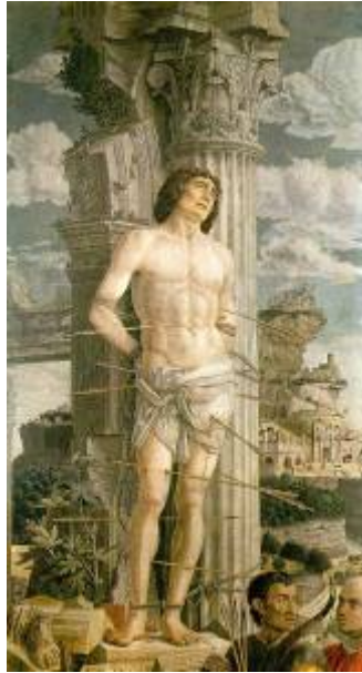
Fig. 3 - Andrea Mantegna, San Sebastiano , 1480

L'albero era immerso nel silenzio, ma adesso il narratore associa l'immagine dell'albero a quella di una musica, definita "sacra".