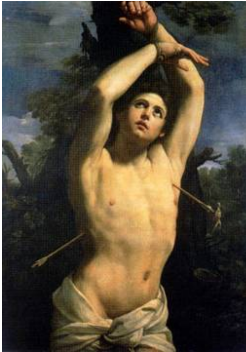
Fig. 1 - Guido Reni, San Sebastiano 1615 circa