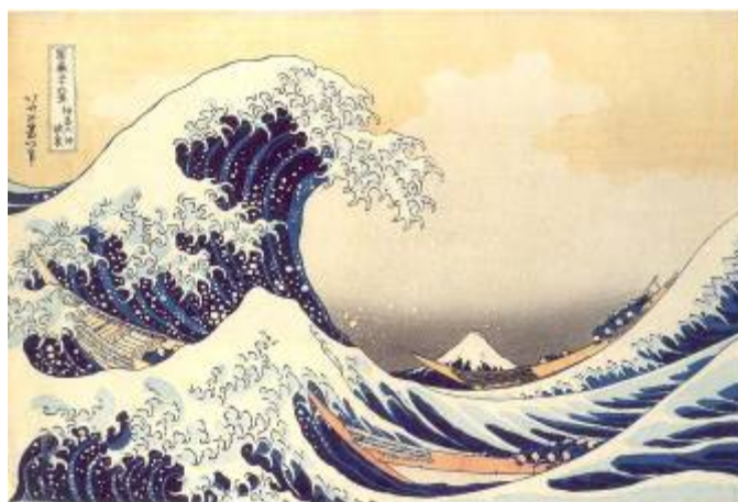
Fig. 4 - Katsushika Hokusai, La grande onda al largo di Kanagawa